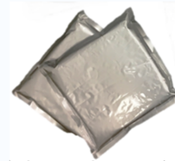
凍結庫から出したばかりの保 冷剤のマイナス温度冷熱と 冬の低温に対応する蓄熱剤