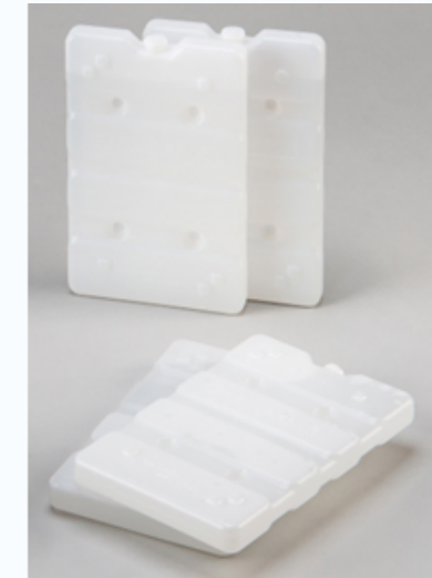
3℃を一定に保つクールラボ3