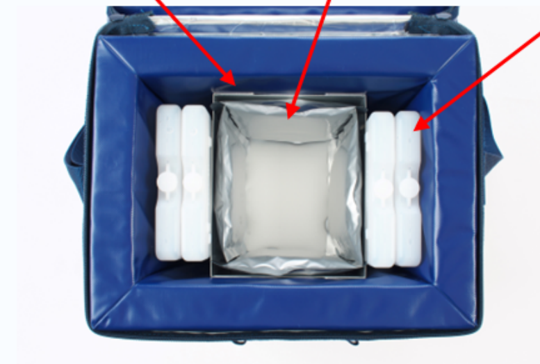
2-8℃ 48時間保持セット (クールラボ3を2枚、アルミ仕切りを大きくした24時間セットもあります)