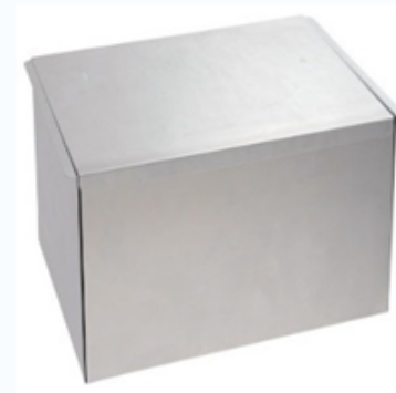
冷熱を均一に伝える アルミ仕切り