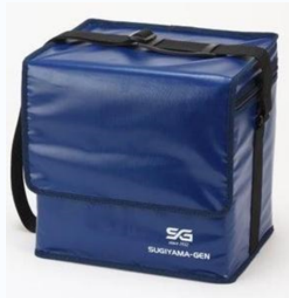
高断熱容器 BioBox Cell

クールラボ3を活用した医薬品向け「定温輸送容器セット」は、2-8℃の医薬品輸送に必要な待機時間をなくし、かつ、年間を通した同一運用を実現した業界初、画期的なセットです。医薬品の定温輸送を効率化します。